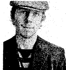
Né en France, Gilles Peterson ravit le tout Londres.

Mercredi 13 octobre à 21 h. Tarif : 34 € (réduit 28 €, enfants 17 €).