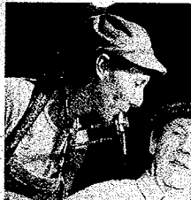
Un duo à la mentalité de routard.

Samedi 16 octobre à 20 h 45. salle municipale. Soirée cabaret, entrée : 8 €. Réservation conseillée : tél. 02.54.71.32.84.